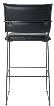
Ohne & mit arm, kupfer