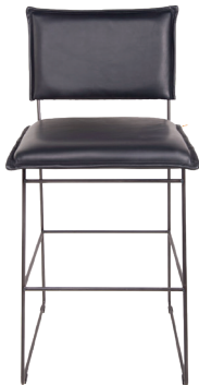
Ohne & mit arm, old glory